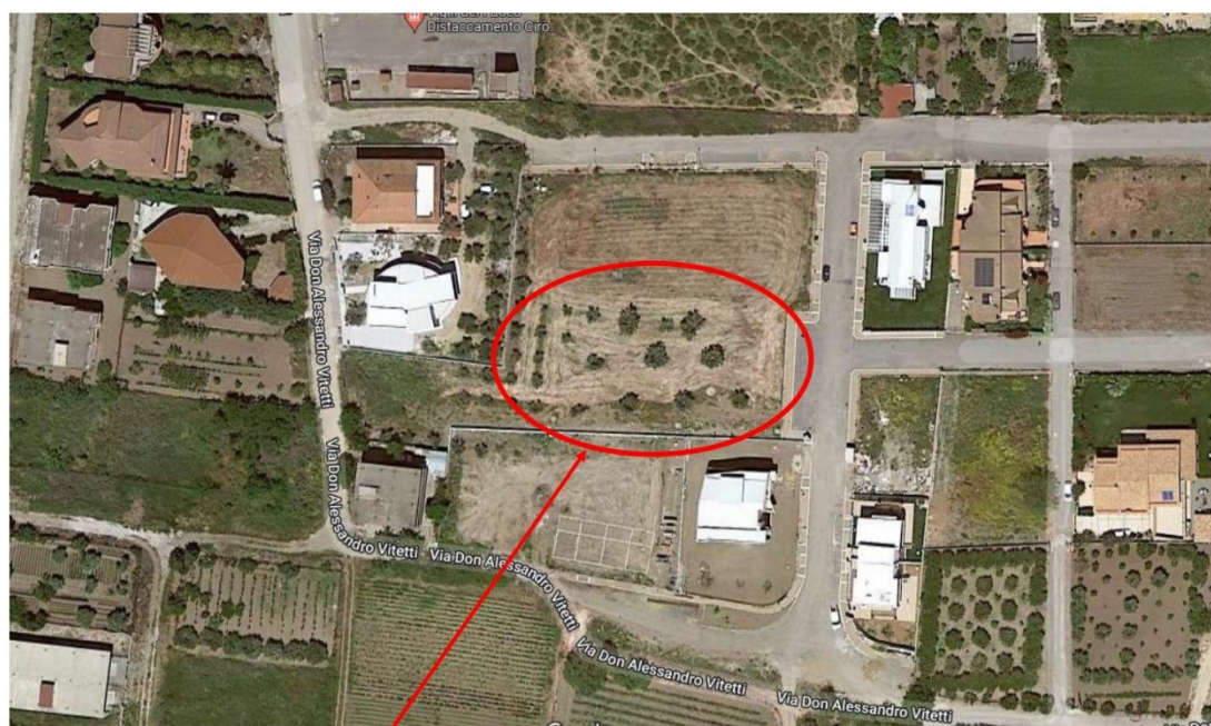
TERRENO OGGETTO DI INTERVENTO